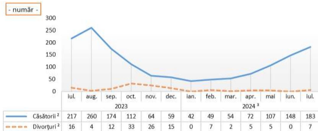
Evoluția numărului de căsătorii și divorțuri, în perioada iulie 2023 – iulie 2024

În luna iulie 2024 s-au înregistrat 7 divorțuri pronunțate în instanță și pe cale administrativă, în luna precedentă nu s-au înregistrat cazuri, iar în luna corespunzătoare din anul precedent, s-au înregistrat 16 cazuri.