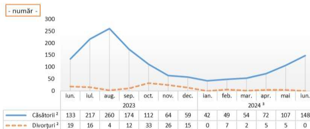
Evoluția numărului de căsătorii și divorțuri, în perioada iunie 2023 – iunie 2024

2 ) Date definitive. 3 ) Date provizorii.