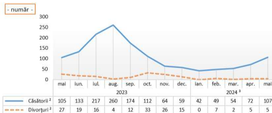
Evoluția numărului de căsătorii și divorțuri, în perioada mai 2023 – mai 2024

2 ) Date definitive. 3 ) Date provizorii.