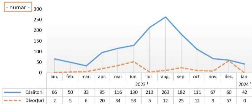
Evoluția numărului de căsătorii și divorțuri, în perioada ianuarie 2023 – ianuarie 2024

1) Date provizorii (repartizate după luna înregistrării evenimentului demografic).